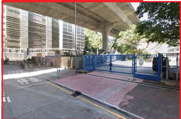
長沙灣蝴蝶谷道寵物公園