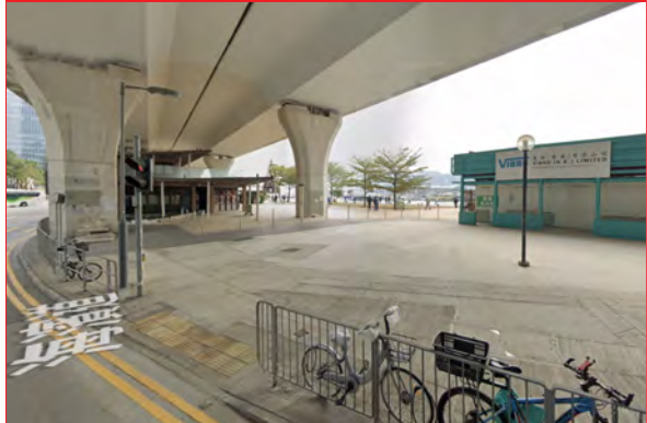
觀塘海濱花園 (海濱道)