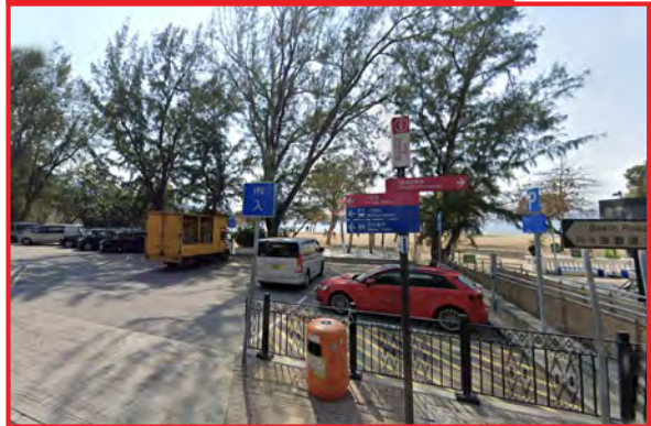
淺水灣海灘道停車場