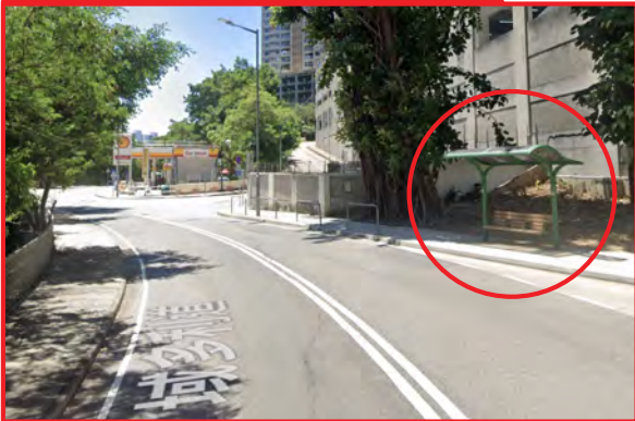
域多利道油站旁休憩處