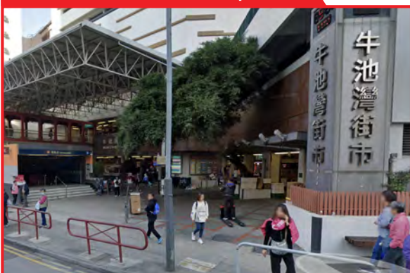
牛池灣街市對出空地