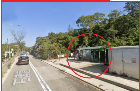
港島徑第八段起點旁