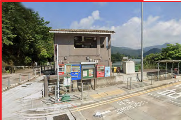
大潭水塘南門閘口